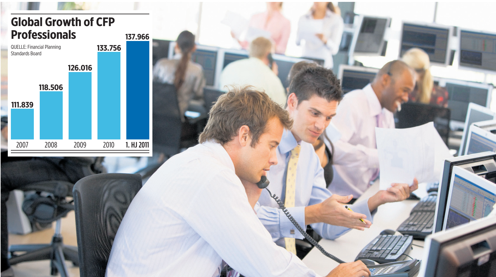
Die weltweite Zunahme der Berater mit CFP-Zertifikat bestätigt den eingeschlagenen Weg.